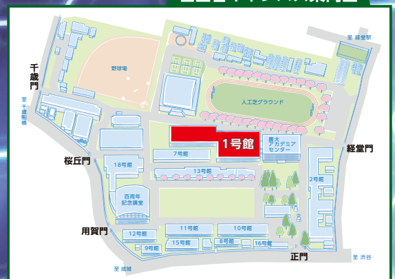
世田谷キャンパス案内図

※懇親会に参加される方は7/21(木)までにセンター事務局までご連絡ください(会費2,000円)